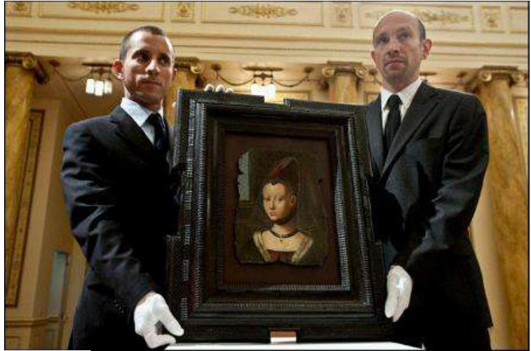
Илл. 5 Петрус Кростус (Питер Кристофсен) «Портрет молодой девушки»